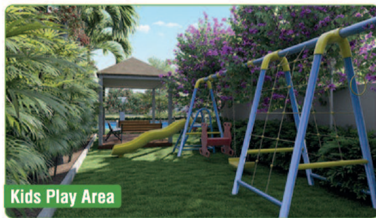
Kids Play Area